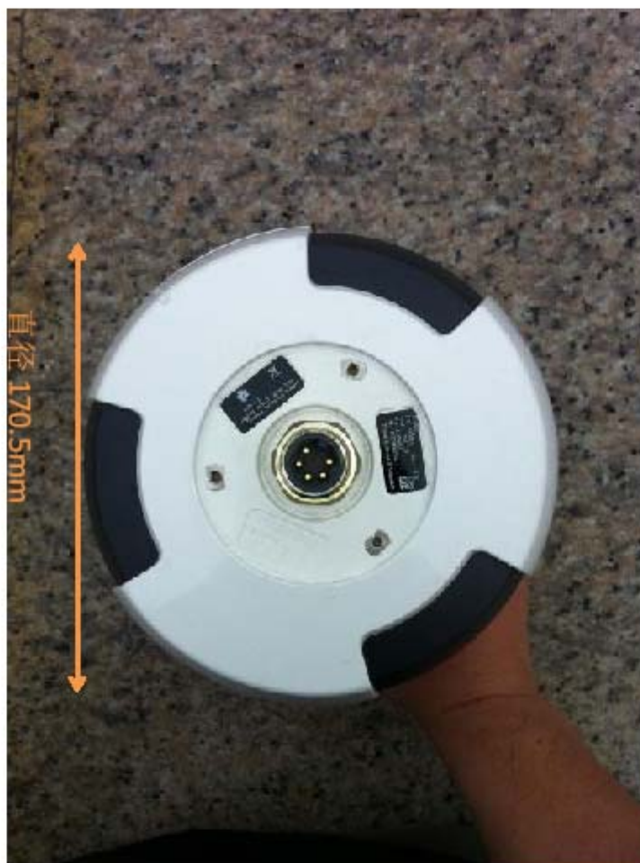
SAILOR 6150 MINI-C (底面接口照) 尺寸: 直径 170.5mm 高: 145mm