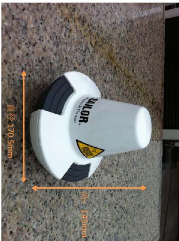
SAILOR 6150 MINI-C (正面照) 尺寸: 直径 170.5mm 高: 145mm