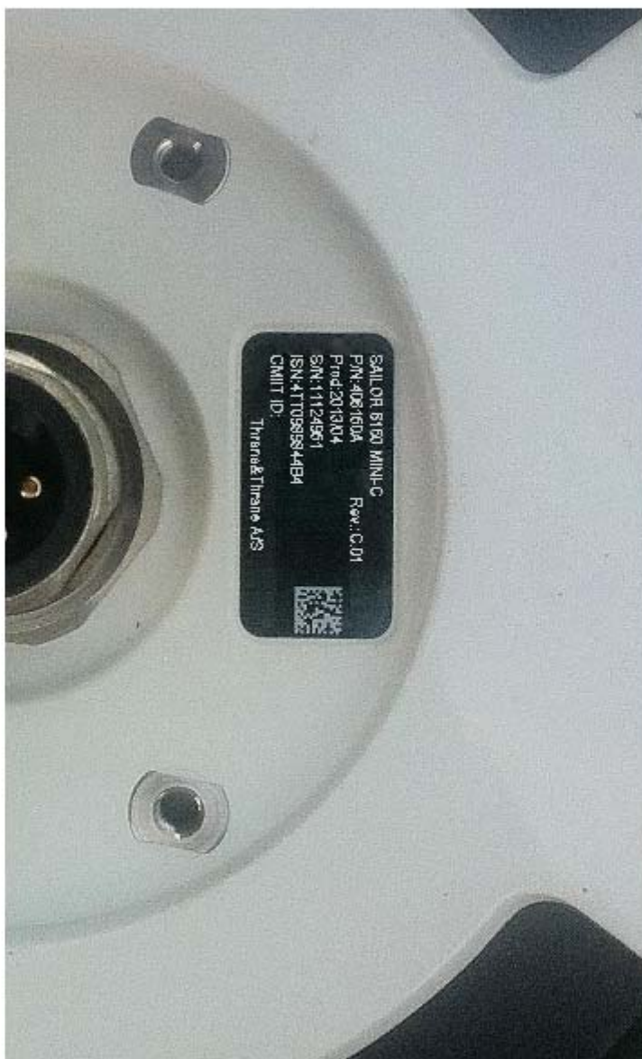
SAILOR 6150 MINI-C (铭牌照) 测试设备-2