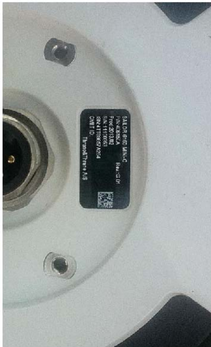
SAILOR 6150 MINI-C (铭牌照) 测试设备-1