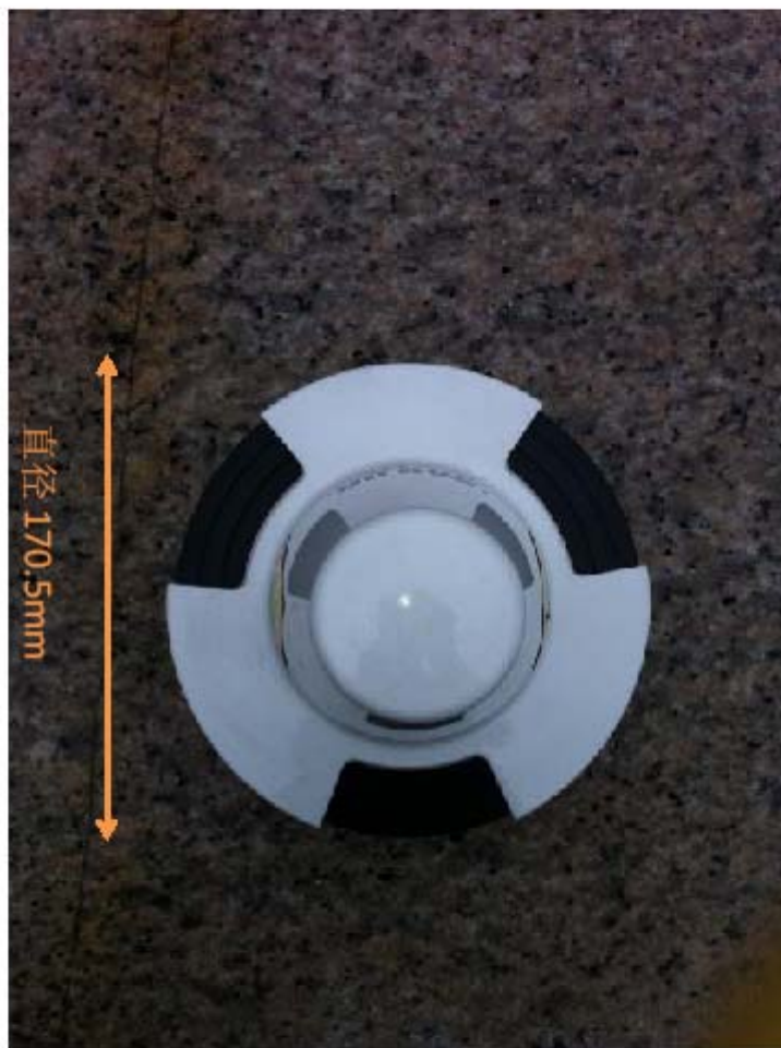
SAILOR 6150 MINI-C (底面照) 尺寸: 直径 170.5mm 高: 145mm