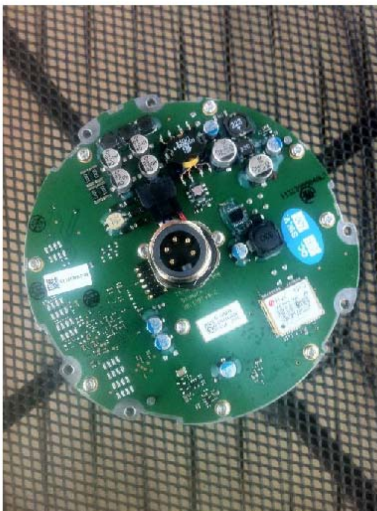
SAILOR 6150 MINI-C PCB电路板照片